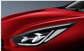
Runway Red (CR5)