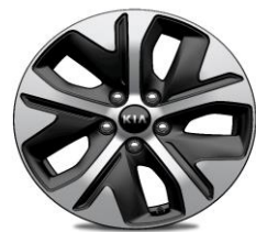
Cerchi in Lega da 17" 215/55 R17