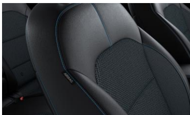
Sedili in misto pelle/tessuto