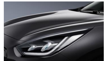
Interstellar Gray (AGT)