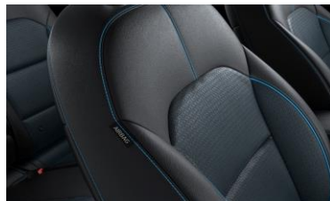
Sedili in pelle