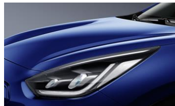
Yacht Blue (DU3)