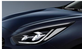
Gravity Blue (B4U)