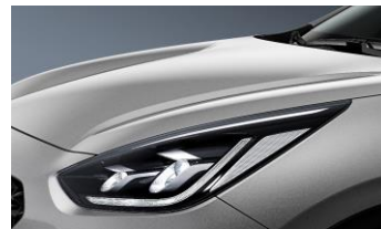
Silky Silver (4SS)