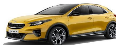
Quantum Yellow (YQM)