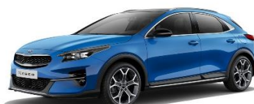
Blue Flame (B3L)