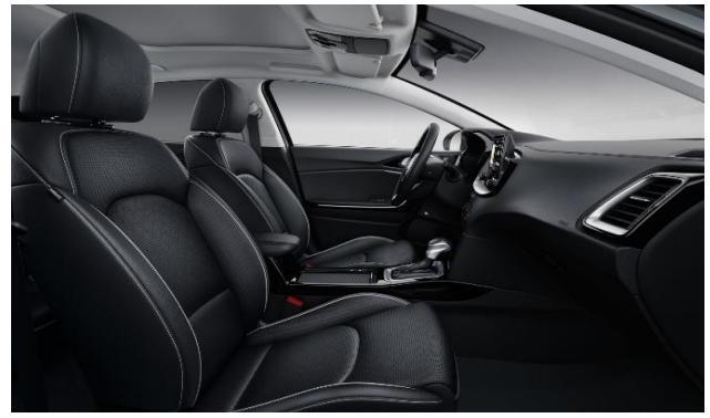
Interni in pelle disponibili con Lounge Pack