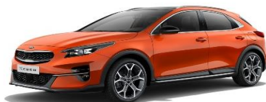
Orange Fusion (RNG)