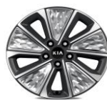
Cerchi in Lega da 17" 215/55 R17