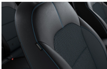
Sedili in misto pelle/tessuto