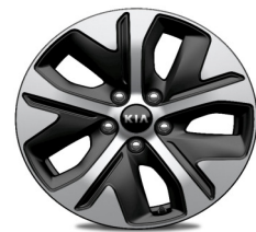
Cerchi in Lega da 17" 215/55 R17