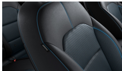
Sedili in pelle