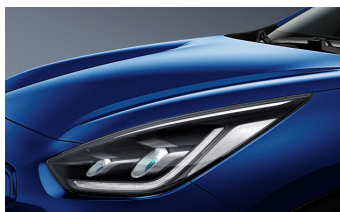
Yacht Blue (DU3)