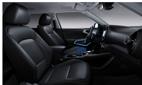
Sedili in pelle (SUV Pack)