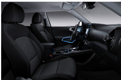
Sedili in tessuto di serie