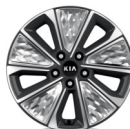
Cerchi in Lega da 17" 215/55 R17