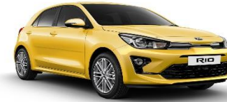
Most Yellow (MYW)