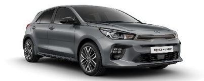
Perennial Grey (PRG)