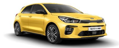
Most Yellow (MYW)