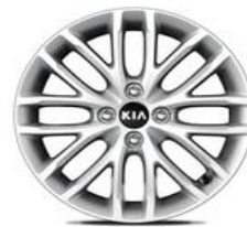
Cerchio in lega da 15" 185 65 R15