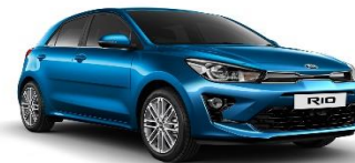
Sporty Blue (SPB)