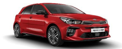
Signal Red (BEG)