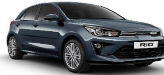
Smoke Blue (EU3)