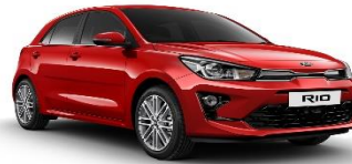
Signal Red (BEG)