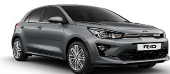
Perennial Grey (PRG)