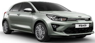
Urban Green (URG)