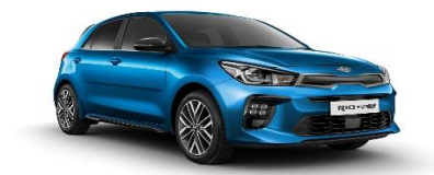
Sporty Blue (SPB)