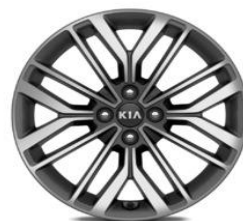
Cerchio in lega da 17" 205 45 R17