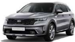
Steel Grey (KLG)