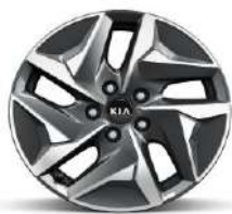
Cerchio in lega da 17" (Solo HEV)