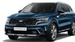
Gravity Blue (B4U)