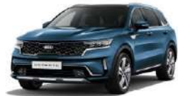
Mineral Blue (M4B)