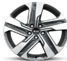
Cerchio in lega da 19"