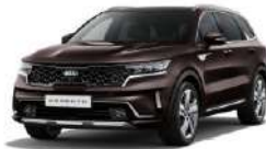
Essence Brown (BE2)