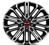
Cerchi in lega da 17" 225/40 R18 GT