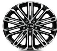
Cerchi in lega da 18" 225/40 R18 GT Line