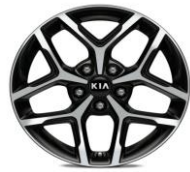
Cerchi in lega da 17" 225/45 R17 GT Line