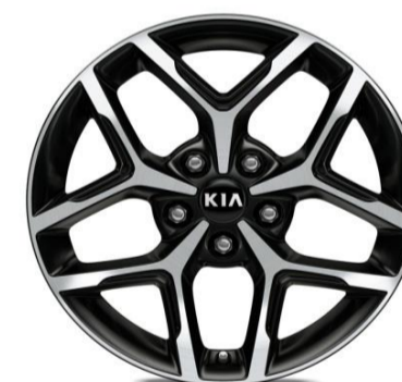
Cerchi in lega da 17" 225/45 R17 GT Line