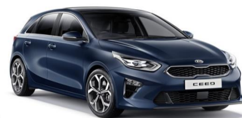
Cosmo Blue (CB7) n.d. per GT Line