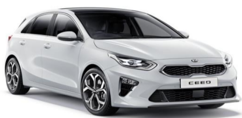
Cassa White (WD)