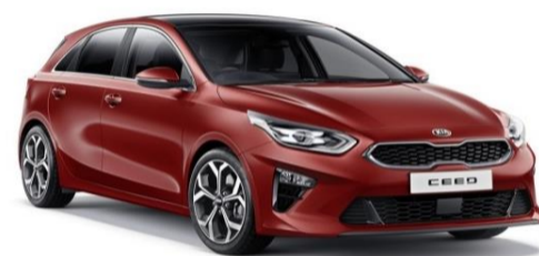
Infra Red (AA9)