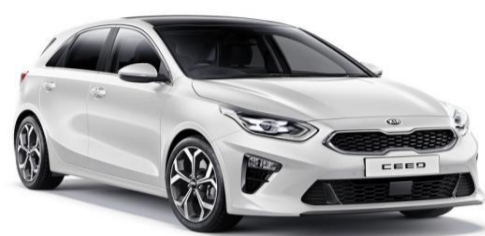
Deluxe White (HW2)