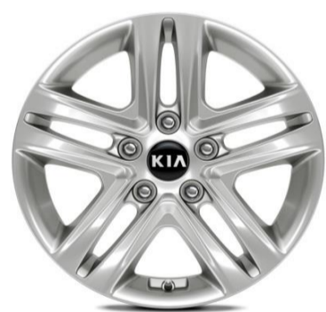
Cerchi in lega da 16" 205/55 R16