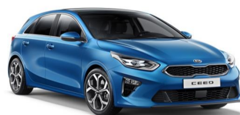
Blue Flame (B3L)