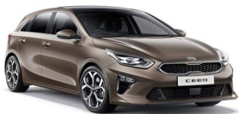
Copper Stone (L2B) n.d. per GT Line