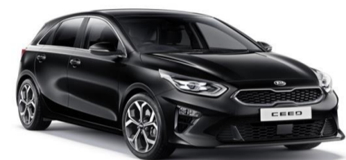
Aurora Black Pearl (1K)