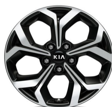
Cerchi in lega da 17" 225/45 R17