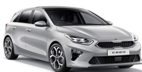
Sparkling Silver (KCS)