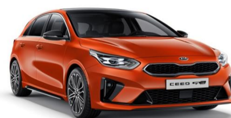
Orange Fusion (RGB) disponibile solo per GT Line