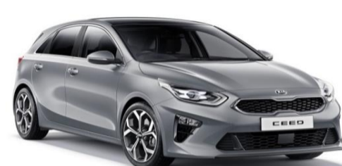
Lunar Silver (CSS)