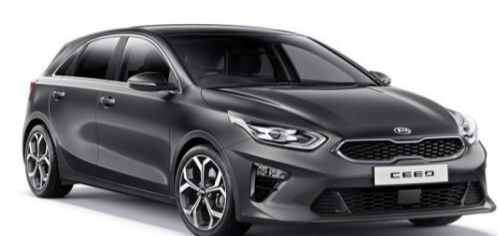
Dark Penta Metal (H8G)