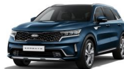
Gravity Blue (B4U)