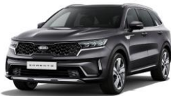
Platinum Graphite (ABT)