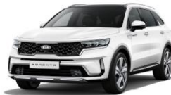
Snow White Pearl (SWP)