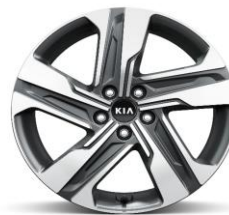
Cerchio in lega da 19"