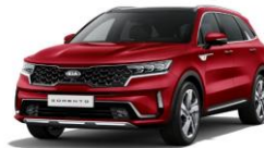
Runway Red (CR5)