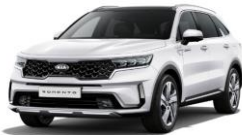
Clear White (UD)