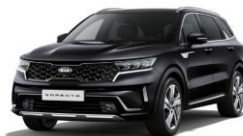
Aurora Black Pearl (ABP)