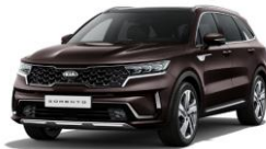
Essence Brown (BE2)