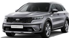
Steel Grey (KLG)