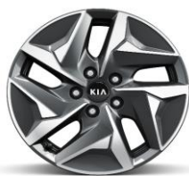
Cerchio in lega da 17" (Solo HEV)