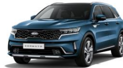
Mineral Blue (M4B)