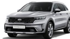
Silky Silver (4SS)